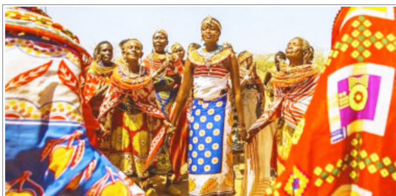
इस गांव में रहती हैं सिर्फ औरतें, पुरुषों के लिए है नो एंट्री

वीडियो संदेश में कहा कि पिछले साल यूक्रेन पर रूस के आक्रमण की शुरुआत के बाद से लवीव के नागरिक बुनियादी ढांचे पर यह सबसे बड़ा हमला था। देश के पूर्वी हिस्से से हजारों लोग सुरक्षा की खातिर लवीव में शरण लिए हुए हैं। यूक्रेन और रूस ने विश्व के सबसे बड़े परमाणु संयंत्रों में से एक पर हमले की तैयारी करने का एक-दूसरे पर आरोप लगाया। हालांकि दोनों पक्षों में से किसी ने भी इस खतरे के अपने दावे के समर्थन में सबूत मुहैया नहीं कराए। यह परमाणु संयंत्र दक्षिण पूर्व यूक्रेन में है और इस पर रूसी सैनिकों का कब्जा है।