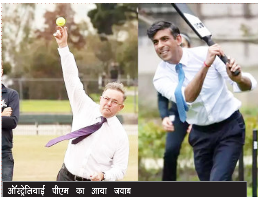
ऑस्ट्रेलियाई पीएम का आया जवाब

दूसरी ओर, ऑस्ट्रेलियाई प्रधानमंत्री एंथनी अल्बनीज भी इस विवाद में शामिल हो गए। उन्होंने अपने ट्विटर अकाउंट पर कहा है कि ऑस्ट्रेलिया अपनी राष्ट्रीय क्रिकेट टीम के साथ खड़ी है। अल्बनीज ने कहा, मुझे पुरुष और महिला क्रिकेट टीमों पर गर्व है, जिन्होंने इंग्लैंड के खिलाफ अपने शुरुआती दो एशेज मैच जीते हैं।