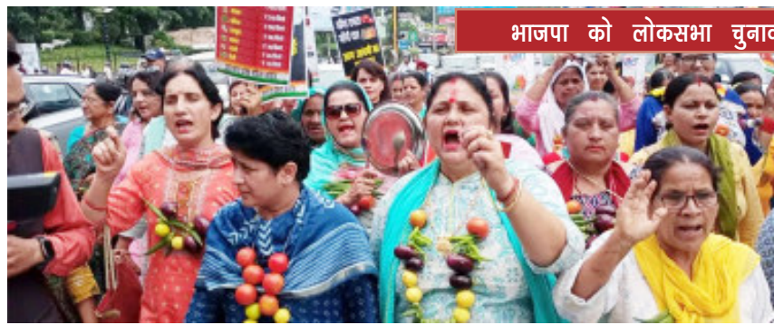
भाजपा को लोकसभा चुनाव में चुकाना पड़ेगा आमियाजा

महंगाई के खिलाफ महिला कांग्रेस का प्रदर्शन, सरकार को दिया अल्टीमेटम