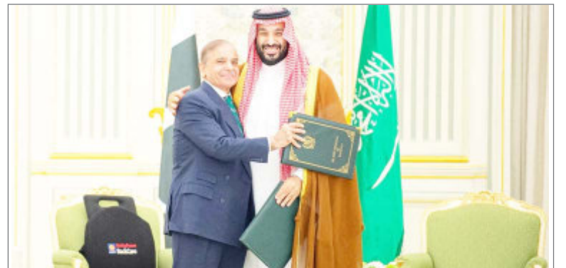
मिडिल ईस्ट में जारी जंग के बीच फंसा पाकिस्तान

बीच स्ट्रेट ऑफ होर्मुज को चोक कर दिया है, जिससे ग्लोबल एनर्जी सप्लाई लाइन रुक गई है। ईरान और ओमान के बीच इस जलडमरूमध्य से दुनिया की 80 फीसदी ऊर्जा सप्लाई गुजरती है। पाकिस्तानी मीडिया रिपोर्ट के मुताबिक, कीमतें बढ़ाने का जानकारी शुक्रवार देर रात इमरजेसी प्रेस कॉन्फ्रेंस के दौरान दी गई। कीमतों में वृद्धि के बाद पाकिस्तान में पेट्रोल की कीमत 321.17 पाकिस्तानी रुपये प्रति लीटर और हाई-स्पीड डीजल के कीमत 335.86 प्रति लीटर हो गई है। तेल की कीमतों के बढ़ने की खबर आते ही पाकिस्तान में अफरा-तफरी मच गई।