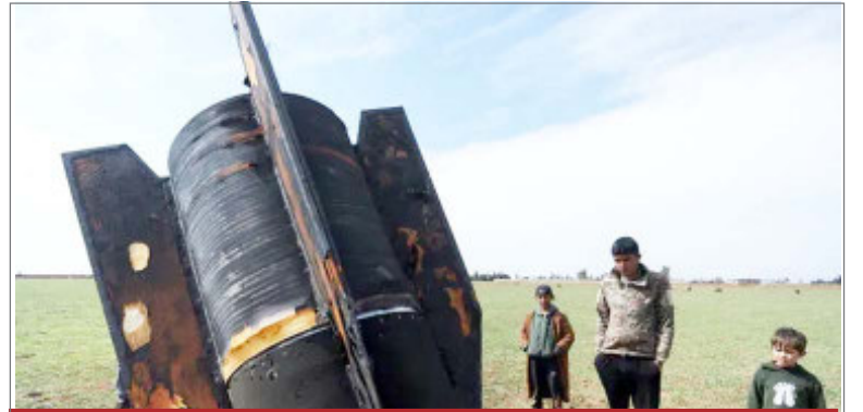
सीरिया में फुसस हुई ईरानी मिसाइल

रिपोर्ट के मुताबिक, यूनाइटेड अरब अमीरात में दो जगहों पर ऐसे ही रडार सिस्टम वाली बिल्डिंग्स पर भी हमला हुआ, लेकिन अभी तक यह साफ नहीं है कि इक्विपमेंट डैमेज हुआ या नहीं। रडार हाई-एंड मिसाइल इंटरसेप्टर सिस्टम के लिए एक जरूरी एलिमेंट है, जिसका इस्तेमाल बैलिस्टिक मिसाइलों को उनके टारगेट की ओर उड़ते समय एंगेज करने और खत्म करने के लिए किया जाता है। यूएस आठ थाड बैटरी ऑपरेंट करता है।