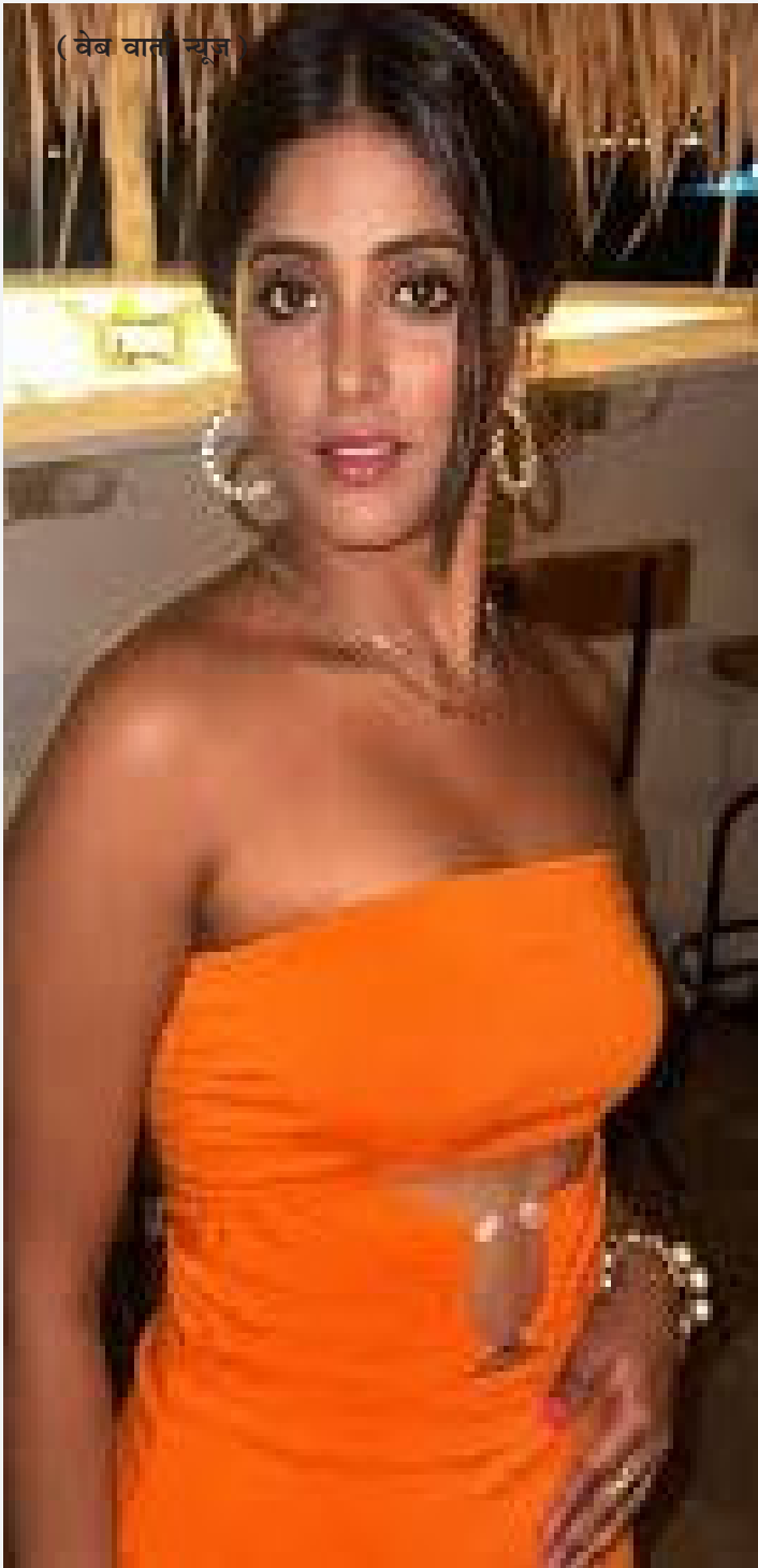
(वेब वार्ता न्यूज)