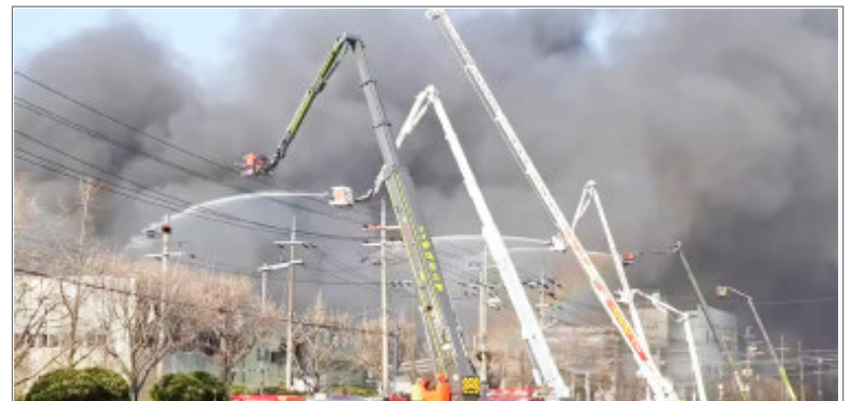
दक्षिण कोरिया की फैक्ट्री में भीषण हादसा

6 मार्च से पश्चिमी वॉल, अल-अक्सा मस्जिद और चर्च ऑफ द होली सेपल्कर जैसे कई धार्मिक स्थल बंद हैं। पूरे इजरायल में भीड़ पर भी पाबंदी लगाई हुई है। यरुशलम के पुराने शहर के गेट पर ईद की नमाज के दौरान सैकड़ों नमाजियों और पुलिस के बीच झड़प भी हो गई।