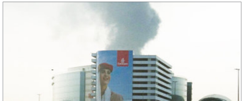
ईरान के ड्रोन अटैक के बाद अबू धाबी में गिरी मिसाइल

ताइवान की सेना को चीनी युद्धक विमानों पर नजर रखने की आदत हो गई है। द्वीप के पास चीन के कभी-कभी कुछ ही विमान दिखाई देते हैं, तो कभी-कभी उनकी संख्या काफी अधिक हो जाती है। लेकिन चीन के फाइटर जेट लगातार ही आसमान में चक्कर लगाते नजर आते हैं। चीन के ये फाइटर जेट जब लगभग दो सप्ताह तक द्वीप के आस-पास दिखाई नहीं दिए और इनका हवा में चक्कर काटना अचानक बंद हो गया, तो ताइवान के लिए यह सन्नाटा चौंकाने वाला और बेहद रहस्यमय हो गया था। ताइवान की सेना के मुताबिक, यह