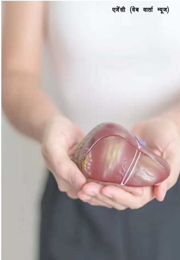
एजेंसी (वेब वार्ता न्यूज)