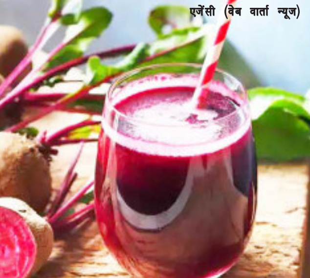
एजेसी (वेब वार्ता न्यूज)