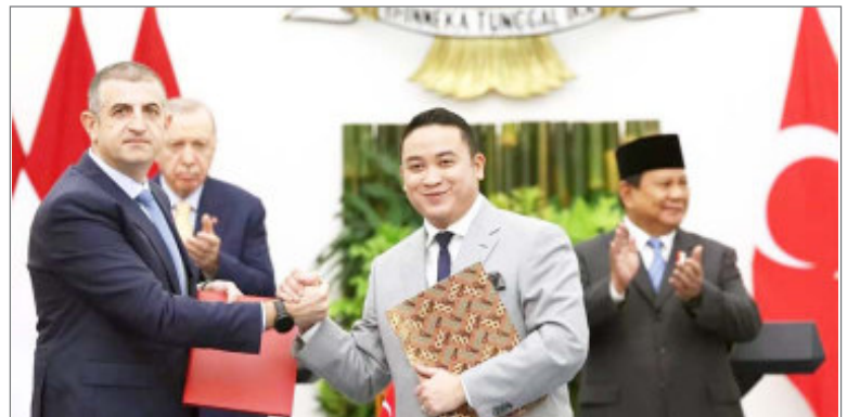
भारत के पड़ोसी दोस्त ने तुर्की के साथ की महाडील