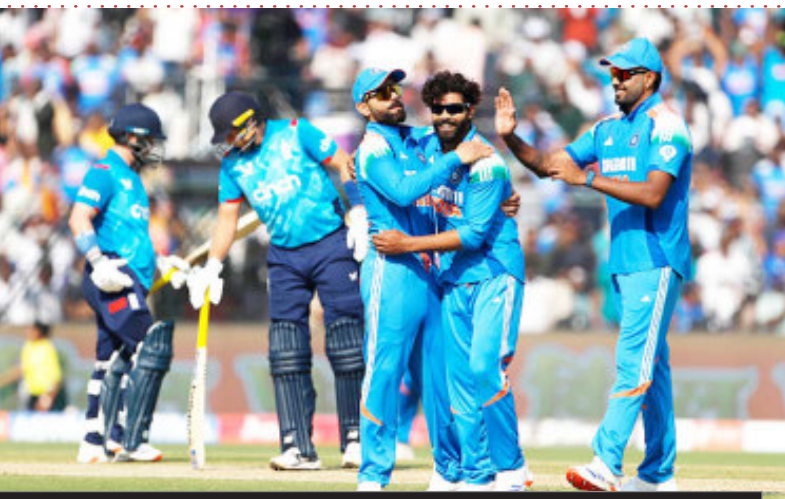
पीटरसन ने सोशल मीडिया पर निकाली भड़ास

पीटरसन ने मैच के बाद अपने विचार सोशल मीडिया पर भी प्रकट किए। पीटरसन ने इंग्लैंड के खिलाड़ियों पर तंज कसते हुए कहा कि निराशाजनक हार के बाद खिलाड़ियों ने नेट सेशन करने के बजाय गोल्फ खेलना बेहतर समझा। मैं समझ गया। आप समय का आनंद उठाएं। यह आपके जिंदगी के सबसे शानदार समय में से एक है। गोल्फ खेलें और अपना समय शानदार बनाएं। इंग्लैंड के लिए खेलने का आनंद उठाएं। मगर क्रिकेट में आपाके रन बनाने के पैसे मिलते हैं। आपको मैच जीतने के पैसे मिलते हैं।