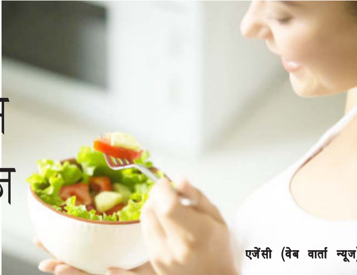
एजेंसी (वेब वार्ता न्यूज)