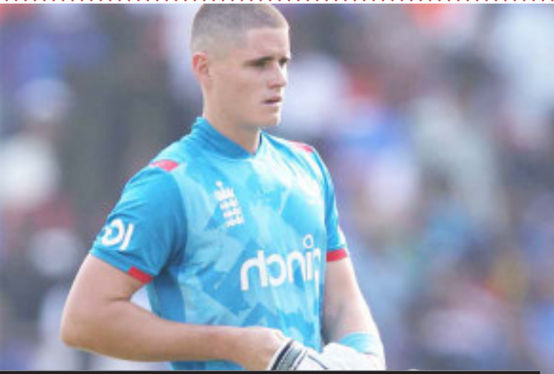
इंग्लैंड की मुश्किलें बढ़ी

चैंपियंस ट्रॉफी 2025 का आगाज 19 फरवरी से होना है। इस टूर्नामेंट से पहले जैकेब का चोटिल होना इंग्लैंड की टीम के कप्तान जोस बटलर के लिए काफी टेंशन की बात हो गई है। बता दें कि इस टूर्नामेंट के लिए टीम में बदलाव की आखिरी तारीख 12 फरवरी है। इसके बाद टूर्नामेंट के दौरान अगर कोई खिलाड़ी बाहर होता है, तो उसके रिप्लेसमेंट के लिए आईसीसी की टेक्निकल टीम की मंजूरी लेनी होती है।