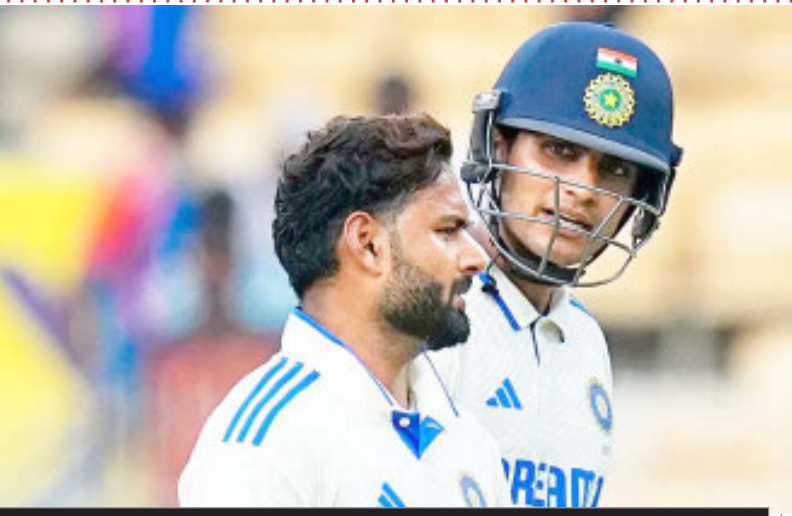
गिल की जगह अभिषेक शर्मा को मिलेगा मौका

एक रिपोर्ट की मानें तो जिम्बाब्वे दौरे पर टी20 टीम में शामिल प्लेयर्स को एक बार फिर मौका मिलेगा। इसमें शुभमन गिल की जगह अभिषेक शर्मा की वापसी संभव है। हालांकि, इस बात का पता नहीं है कि उनके साथ ओपनर कौन होगा। अगर यशस्वी जायसवाल को आराम नहीं दिया गया तो वह ओपनर हो सकते हैं। माना जा रहा है कि टी20 सीरीज के पहले मैच में यशस्वी जायसवाल खेलेंगे, जबकि बचे दो मैचों के लिए ईरानी ट्रॉफी में रेस्ट ऑफ इंडिया के कप्तान रुरुराज गायकवाड़ वापसी करेंगे।