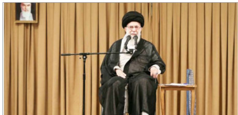
हिजबुल्लाह को घुटनों पर नहीं ला सकता इजरायल

इसके पहले बांग्लादेश की महिला सैन्यकर्मियों को वर्दी के साथ हिजाब पहनने की अनुमति नहीं थी। एडजुटेंट कार्यालय ने निर्देश दिया है कि अलग-अलग वर्दी (लडाकू वर्दी, कामकाजी वर्दी, साड़ी) के साथ हिजाब के सैंपल प्रस्तुत किए जाएं। सैंपल में फैब्रिक, रंग और माप को भी शामिल करने को कहा गया है।