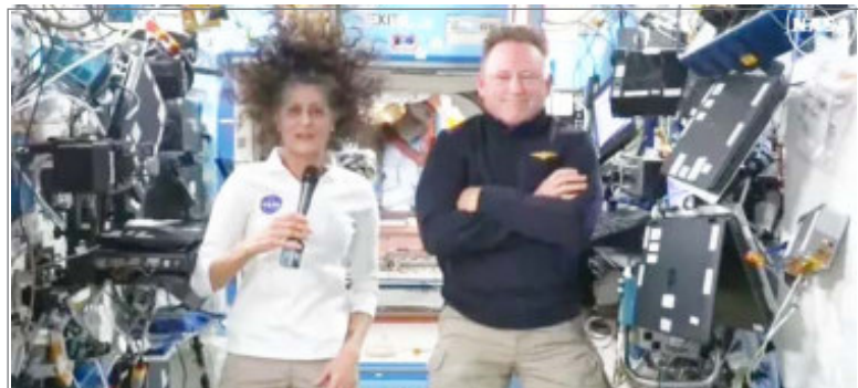
सुनीता विलियम्स की अंतरिक्ष से प्रेस कॉन्फ्रेंस

मिसाइल, अबाबील सिस्टम और संभावित लंबी दूरी तक मार करने वाली मिसाइल के लिए रॉकेट मोटर टेस्टिंग के उपकरण मुहैया करा रहा था। पाकिस्तान का दावा है कि शाहीन मिसाइल की रेंज 2750 किमी है और यह भारत के किसी भी शहर को परमाणु बम या परंपरागत विस्फोटक से निशाना बना सकती है। अमेरिकी विदेश मंत्रालय के प्रवक्ता मैथ्यू मिलर ने कहा कि पाकिस्तान के राष्ट्रीय विकास परिसर और बीजिंग के आटोमेशन फॉर मशीन बिल्डिंग शोध संस्थान के बीच यह सहयोग चल रहा था। वहीं दूसरी ओर अबाबील मिसाइल 2200 किमी तक मार कर सकती है।