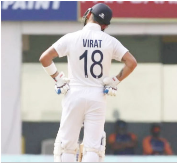
भारत ने ऑस्ट्रेलिया को उसके घर में मात दी थी। भारतीय टीम ऑस्ट्रेलिया को उसके घर में टेस्ट सीरीज में मात देने वाली पहली

बता दें कि विराट कोहली की कप्तानी की शुरुआत 2014 में हुई और उन्होंने 2022 तक इस पद को जिम्मेदारी के साथ निभाया। कोहली के कप्तान रहते भारतीय टीम ने निडर क्रिकेट खेला। कोहली ने टीम में भरोसा जताया कि सभी खिलाड़ी मैच जिता सकते हैं। उन्होंने टीम को विदेश में जीत के लिए भी प्रोत्साहित किया। विराट कोहली की कप्तानी में