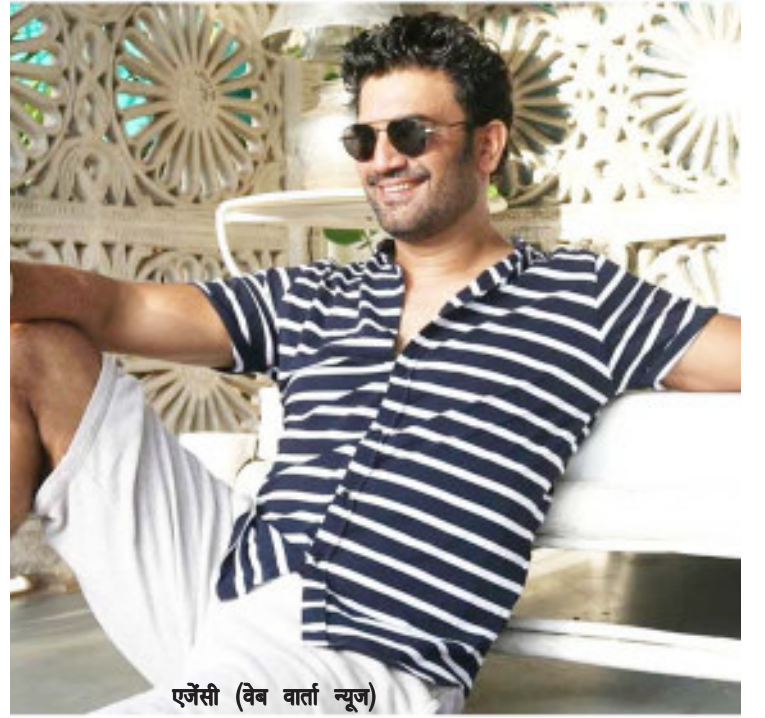
एजेंसी (वेब वार्ता न्यूज)

आया कि उनकी सांस लेने का तरीका गलत था। उन्होंने कहा, मैंने इस पर बहुत काम किया। मैंने कई सारे एक्टरों और लोगों को देखा कि वे कैसे बोलते हैं और उनकी आवाज कितनी अच्छी है। मेरे साथ खास कर सांस लेने की दिक्कत थी। उन्होंने कहा था कि कुछ अक्षर ऐसे होते हैं जिन्हें बोलने के लिए एक खास जगह सांस की जरूरत होती है। उन्होंने कहा कि इसे सुधारा जा सकता है।