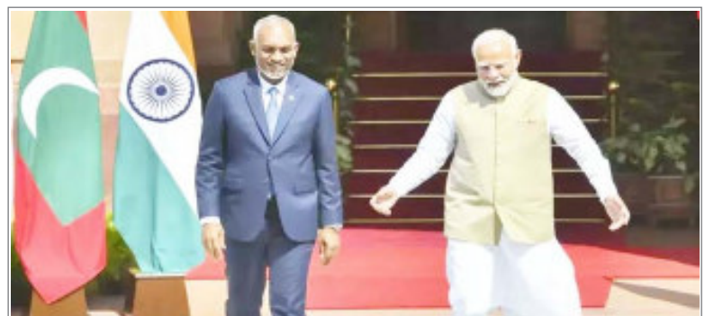
मुइज्जू के मालदीव में लगेगे भारत के रेडार

हार जाते हैं, तो तुम्हें क्या लगता है मेरी जेल की सजा कितनी लंबी होगी? मैं समझता हूँ कि ट्रंप यह चुनाव नहीं जीतते हैं, तो यह हमारा आखिरी इलेक्शन होगा। ट्रंप की हालिया पेंसिल्वेनिया रैली में मस्क ने पूर्व राष्ट्रपति के लिए अपना समर्थन व्यक्त किया था। कार्लसन के साथ बातचीत के दौरान मस्क ने कहा, अवैध प्रवासियों को जानबूझकर कुछ प्रमुख राज्यों में ले जाया जा रहा है, जहां उन्हें नागरिकता दी जाएगी और वे डेमोक्रेटिक पार्टी के पक्ष में मतदान करेंगे। ये एक बड़ा खेल चल रहा है क्योंकि स्विंग-स्टेट मार्जिन कभी-कभी दस-बीस हजार वोटों का होता है।