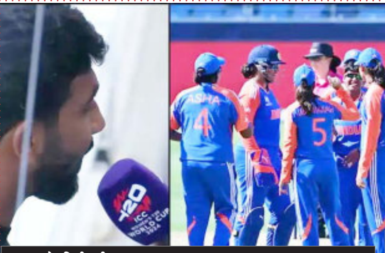
भारत को मिली जीत

भारतीय महिला टीम ने पाकिस्तान को मात दे वर्ल्ड कप में अपना खाता खोला। टीम इंडिया ने ये मैच छह विकेट से अपने नाम किया। पाकिस्तान की टीम पहले बल्लेबाजी करते हुए आठ विकेट खोकर 105 रन बनाए। भारत ने ये टारगेट 18.5 ओवरों में चार विकेट खोकर हासिल कर लिया। वहीं भारत की पुरुष टीम भी मैदान पर थी और उसका सामना बांग्लादेश से था। यहां भी भारत को जीत मिली। सूर्यकुमार यादव की कप्तानी वाली टीम इंडिया ने बांग्लादेश को सात विकेट से हरा दिया।