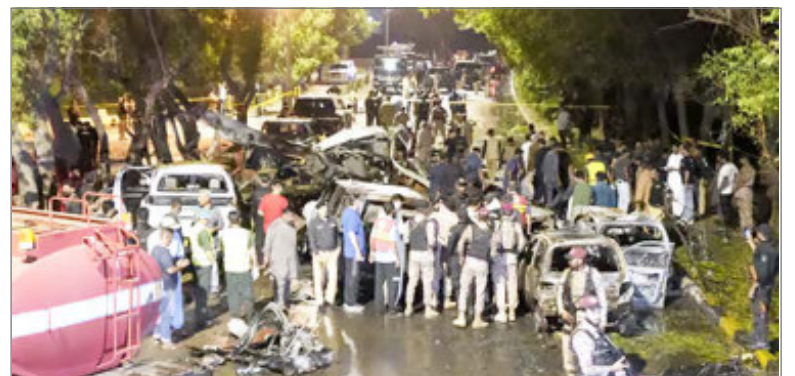
पाकिस्तान में कराची एयरपोर्ट के पास बड़ा धमाका

जाकिर नाइक ने पहले तो कहा कि जब आप इतिहास पढ़ेंगे तो देखेंगे कि इस्लाम के शासन में गैर मुस्लिम सबसे ज्यादा महफूज (सुरक्षित) होते हैं।