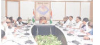
मिसिंग लिंक फंड के तहत पूरे किए जाएंगे प्रोजेक्ट्स

■ सचिवों की अनुपस्थिति में पत्रावली सम्बन्धित शासकीय कार्यों में विलम्ब न हो ■ समाधान को किसी भी समय सीधा मुख्य सचिव से सम्पर्क करने हेतु अधिकारियों को निर्देश