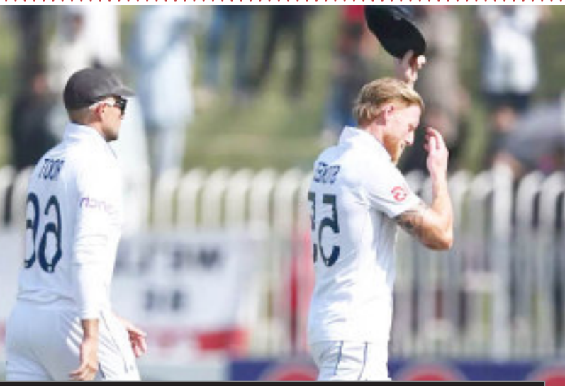
इन बल्लेबाजों को बताया बेकार

बायकॉट ने आगे बढ़ते हुए इंग्लैंड के कुछ बल्लेबाजों के नाम लिए और कहा कि उनके पास स्पिनरों को खेलने की सही तकनीक नहीं है। उन्होंने कहा, जैसे ही गेंद स्पिन होती है जैक क्रॉले, ओली पोप, हैरी ब्रुक और स्टोक्स सभी परेशान हो जाते हैं। वह गेंद को सख्त हाथों से खेलते हैं और उनके बैट-पैड में गैप रह जाता है। अगर ये लोग बाउंड्रीज नहीं लगाते हैं तो धैर्य खो बैठते हैं। स्पिन पिचों पर धैर्य और एकाग्रता सबसे अहम होती है।