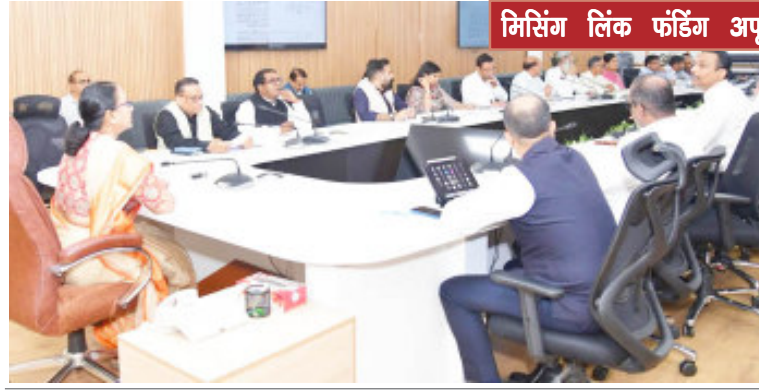
मिसिंग लिंक फंडिंग अपूर्ण योजनाओं को पूरा करने का स्वर्णिम अवसर

मुख्य सचिव ने सचिव वित्त को सभी विभागों से तत्काल प्रस्ताव लेने के लिए निर्देश