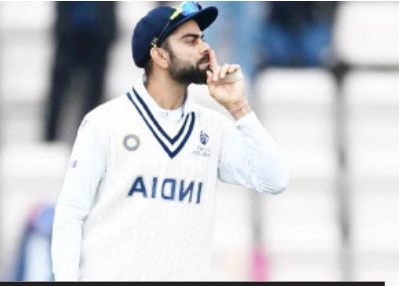
रोहित शर्मा बनने वाले हैं नंबर वन

रोहित शर्मा इस सीरीज के दो मैच जीतते हैं तो बराबरी कर लेंगे, जबकि तीनों जीतने पर विराट कोहली को पीछे छोड़कर नंबर वन भारतीय कप्तान बन जाएंगे। देखने वाली बात हालांकि यह है कि बंगलुरु के चिन्नास्वामी स्टेडियम में पहला टेस्ट कब शुरू हो सकेगा। मैच के सभी पांचों दिन बारिश की संभावना है। ओवरकास्ट कंडीशन में पेसर्स का जलवा देखने को मिल सकता है।