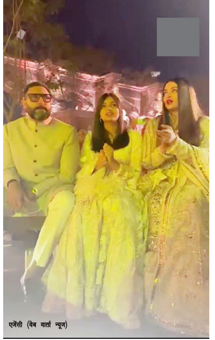
ऐश्वर्या (वेब वार्ता न्यूज)