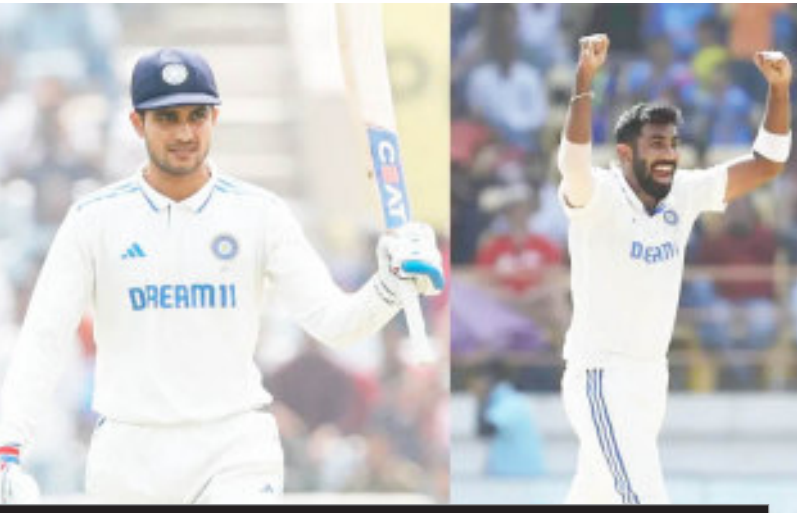
रोहित शर्मा को देना ही पड़ गया जवाब

रोहित ने कहा, 'बुमराह समझता है कि क्या करना जरूरी है। जब आप ऐसी स्थिति में होते हैं जहां आपको एक नेतृत्वकर्ता की जरूरत महसूस होती है तो मुझे लगता है कि बुमराह उनमें से एक होंगे। इसलिए वह शुरू से हमारे नेतृत्व समूह का हिस्सा रहे हैं।' उन्होंने कहा, 'चाहे वह टीम में शामिल नए गेंदबाजों से बात करना हो या टीम को आगे बढ़ाने के संबंध में की जाने वाली चर्चा हो, वह हमेशा नेतृत्व समूह का हिस्सा रहे हैं।' बुमराह ने 2022 में इंग्लैंड के खिलाफ एक टेस्ट मैच में भारत का नेतृत्व किया था।