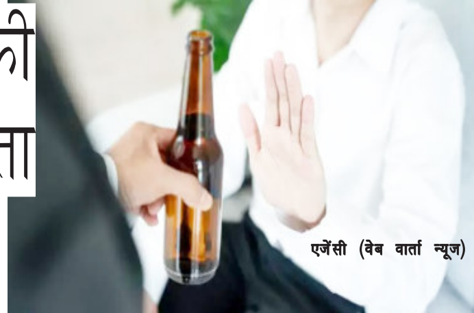
एजेंसी (वेब वार्ता न्यूज)

अल्फा 1 एंटीट्रिप्सिन की कमी एक अनुवांशिक स्थिति है जो फेफड़े और लिवर को नुकसान पहुंचा सकती है। आमतौर पर फेफड़ों के लक्षण एम्फाइजिमा के समान होते हैं जैसे पुरानी खांसी, सांस की तकलीफ और घरघराहट। इलाज से लंग्स डैमेज होने के खतरे को कम किया जा सकता है। अल्फा 1 एंटीट्रिप्सिन की कमी के संकेत, लक्षण और इसके होने की उम्र हर व्यक्ति में अलग अलग होती है। इस समस्या से ग्रस्त लोगों में फेफड़ों की बीमारी के पहले लक्षण आमतौर पर 25 से 50 वर्ष की उम्र के बीच विकसित होता है।