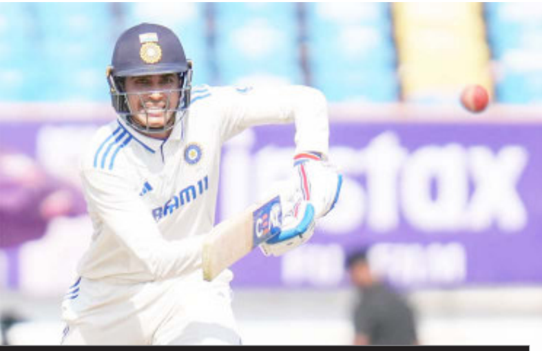
गिल हैं अहम

गिल अगर फिट होंगे तो फिर उनका खेलना तय है। वह टीम इंडिया के अहम सदस्य हैं। नंबर-3 पर वह लंबे समय से खेलते आ रहे हैं। दाएं हाथ के इस बल्लेबाज के आने से टीम को मजबूती मिलेगी। गिल के पास पिछले ऑस्ट्रेलियाई दौरे का अनुभव भी है। भारत के लिए एडिलेड एक बुरे सपने से कम नहीं है। पिछले ऑस्ट्रेलियाई दौरे पर इस मैदान पर सीरीज का पहला टेस्ट मैच खेला गया था जो डे-नाइट मैच था। इस मैच की पहली पारी में टीम इंडिया सिर्फ 36 रन बनाकर ऑल आउट हो गई थी।