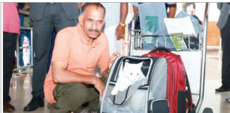
ईवा नामक बिल्ली ने रच दिया इतिहास

मुख्य सलाहकार के प्रेस विंग के एक अधिकारी ने कहा, मुख्य सलाहकार यूनुस ने हसीना के मुकदमे के मुद्दे पर आईसीसी के खिलाफ गिरफ्तारी वारंट जारी कर दिया है।