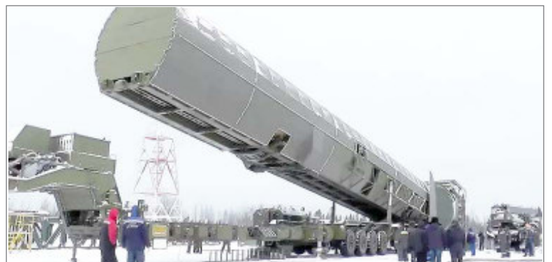
पुतिन ने शैतान-2 मिसाइल तैनात करने का दिया आदेश

इस पोस्ट के साथ उन्होंने एक वीडियो भी संलग्न किया जिसमें स्थानीय इस्लामी समूह