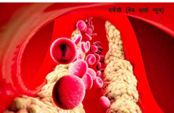
एप्पल (वेब वार्ता न्यूज)