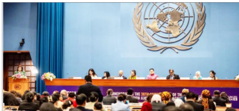
शिक्षा के सभी स्तरों पर लैंगिक समानता हासिल कर ली है: यूएन में भारत