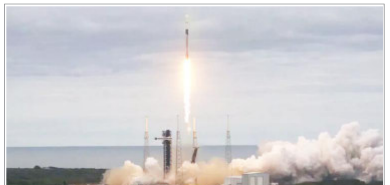
एलन मस्क की मदद से स्पेस में पहुंची भारत की सैटेलाइट

इस्लामाबाद खुद को मुश्किल स्थिति में पाता है क्योंकि ट्रंप से खासा परेशान है। इसकी वजह यह है कि ट्रंप की कैबिनेट में अधिकतर नेता वही हैं, जो पाकिस्तान के प्रति अच्छे विचार नहीं रखते हैं, जो अमेरिकी प्रशासन की भावी विदेश नीति का संकेत की भावी विदेश नीति का संकेत है। बता दें कि जिन नामों का एलान हुआ है, उससे यह स्पष्ट संदेश जाता है कि ट्रंप सरकार के लिए भारत प्राथमिकता सूची