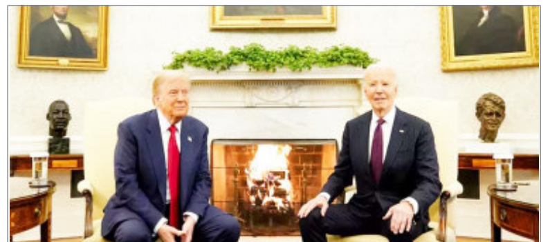
व्हाइट हाउस में जो बाइडन और ट्रंप की मुलाकात

इसके लिए यथासंभव सहायता भेज रहे हैं, जिससे यूक्रेन रूसी सेनाओं को दूर रखने में सक्षम हो सके और संभावित हमले में मजबूत पकड़ बना सके। उन्होंने कहा कि बाइडन चाहते हैं कि जो भी मदद यूक्रेन को दिया जाना है, वह प्रत्येक डॉलर अब से 20 जनवरी के बीच उसे दे दिया जाए।