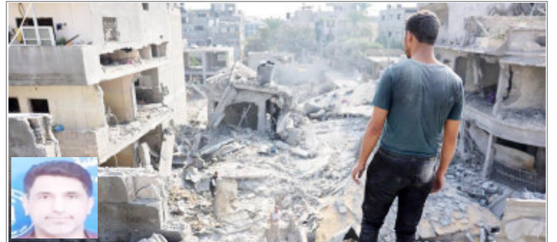
इस्लामिक जिहाद गुट के ऑपरेशन हेड की मौत

14 जून को पुतिन ने युद्ध को समाप्त करने के लिए अपनी शर्तें तय की थी। पुतिन ने कहा था कि यूक्रेन को अपनी नाटो महत्वाकांक्षाओं को छोड़ना होगा और रूस द्वारा दावा किए गए चार क्षेत्रों के सभी क्षेत्रों से अपने सभी सैनिकों को वापस बुलाना होगा।