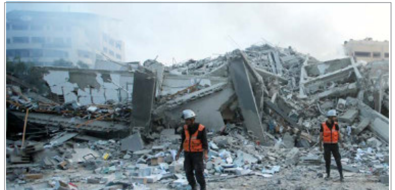
गाजा में भीषण लड़ाई जारी, पीछे हटने को तैयार नहीं इजरायल

लाल सागर में एक जहाज को भी निशाना बनाया है। हत्ती चरमपंथियों के सैन्य प्रवक्ता ब्रिगेडियर जनरल याह्या सारी ने दावा किया कि विद्रोहियों ने गुरुवार को अमेरिकी रीपर ड्रोन को जमीन से हवा में मार करने वाली मिसाइल से हमला करके नष्ट कर दिया। हत्ती प्रवक्ता ने बताया कि रीपर ड्रोन यमन के मारिब प्रांत में शतुत्रापूर्ण कार्रवाई में शामिल था। ये इलाका यमन की निर्वासित सरकार और उसके गठबंधन सहयोगियों के कब्जे में है। एपी की रिपोर्ट के मुताबिक, हत्ती चरमपंथियों ने बाद में ड्रोन को मारे गिराए जाने का फुटेज भी जारी किया।