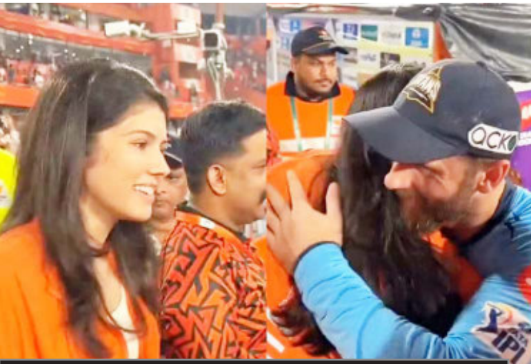
प्लेऑफ में एसआरएच

सनराइजर्स हैदराबाद को मैच रद्द होने का फायदा मिला क्योंकि वो आईपीएल 2024 के प्लेऑफ में क्वालीफाई करने वाली तीसरी टीम बन गई। जी हां, पेट कमिंस के नेतृत्व वाली सनराइजर्स हैदराबाद पर मैच रद्द होने के बाद क्यू यानी क्वालीफाई का ठप्पा लग गया। कोलकाता नाइट राइडर्स और राजस्थान रॉयल्स के बाद अरिज आर्मी प्लेऑफ में क्वालीफाई करने वाली तीसरी टीम बनी।