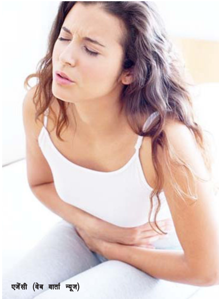
एजेंसी (वेब वार्ता न्यूज)

हार्मोनल तंत्र प्रभावित होता है और जिसका प्रभाव आपके आपके पाचन पर भी पड़ता है। जिससे आपको मतली और उल्टी का अनुभव हो सकता है।