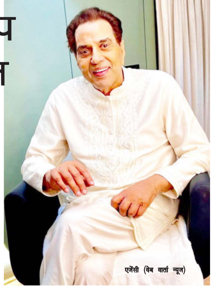
एजेसी (वेब वार्ता न्यूज)

एक अन्य फैन ने कॉमेंट में लिखा है, सर, यह बात तब ही क्यों समझ आती है, जब बातें बीत जाएं। एक तीसरे फैन ने लिखा है, ये बात एक दिन सबको समझ आती है, लेकिन वक्त गुजरने के बाद।