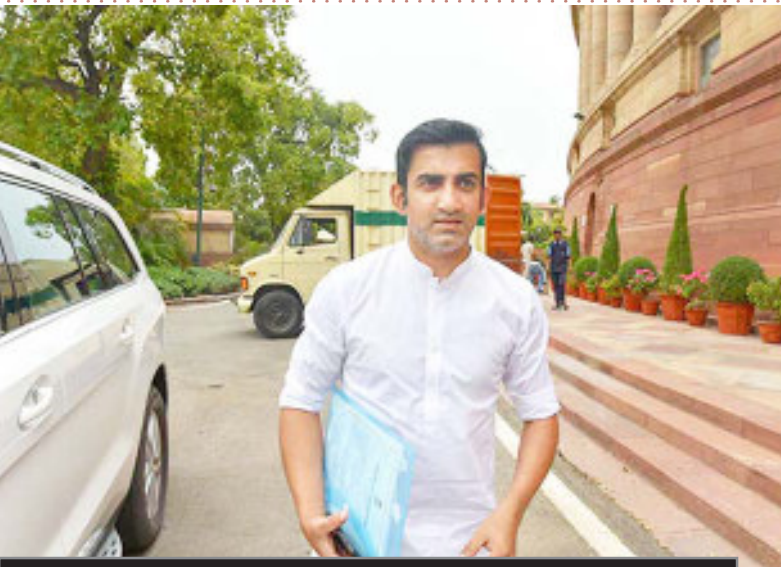
लखनऊ सुपर जायंट्स के रह चुके हैं मेंटर

बता दें कि भारत के पूर्व सलामी बल्लेबाज 2022 और 23 सीजन के दौरान लखनऊ सुपर जायंट्स के लिए मेंटर के रूप में काम कर चुके हैं। गंभीर की मेंटरशिप में लखनऊ सुपर जायंट्स दोनों सीजन में प्लेऑफ तक पहुंचने में सफल रही थी। केकेआर में गंभीर की वापसी की घोषणा 21 नवंबर, 2023 को आधिकारिक की गई थी।