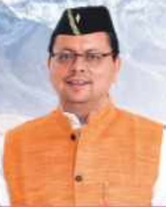
पुष्कर सिंह धामी, मुख्यमंत्री, उत्तराखण्ड