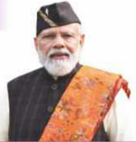
नरेन्द्र मोदी, प्रधानमंत्री

माननीय प्रधानमंत्री श्री नरेन्द्र मोदी के मार्गदर्शन में हम अपने राज्य के समग्र विकास, यहां की प्राकृतिक सुंदरता, समृद्ध सांस्कृतिक विरासत और अपार संभावनाओं को निखारने के लिए प्रतिबद्ध हैं। राज्य की प्रगतिशील नीतियों और रणनीतिक पहल के माध्यम से हम आर्थिक विकास को बढ़ावा देना, बुनियादी ढांचे में सुधार करने और नागरिकों के लिए जीवन की गुणवत्ता को बेहतर की दिशा में अग्रसर हैं। हमारा लक्ष्य उत्तराखण्ड को प्रगति का एक मॉडल बनाना है जहां परंपरा और नवीनता का संगम होता है और जहां हर व्यक्ति राज्य की समृद्धि और कल्याण के लिए कार्य कर विकास में योगदान देता है।