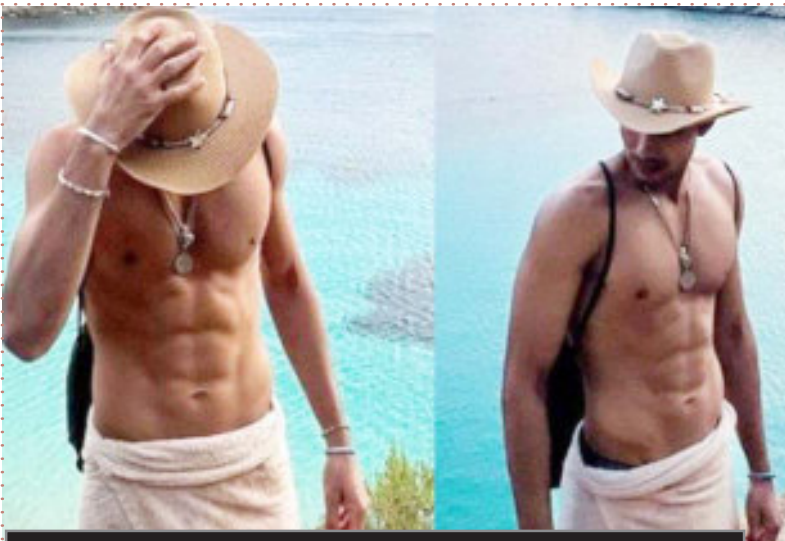
गुजरात की कप्तानी करेंगे शुभमन

शुभमन गिल आईपीएल 2024 में गुजरात टाइटंस की कप्तान संभालते हुए नजर आएंगे। हार्दिक पांड्या के मुंबई इंडियंस लौटने के बाद गुजरात ने इंडियन प्रीमियर लीग के 17वें सीजन के लिए टीम की बागडोर गिल के हाथों में सौंपी है। गुजरात की ओर से खेलते हुए पिछले दो सीजन में भारतीय सलामी बल्लेबाज का प्रदर्शन दमदार रहा है। ऐसे में इस सीजन भी गिल टी-20 वर्ल्ड कप से ठीक पहले बल्ले से धमाकेदार प्रदर्शन जरूर करना चाहेंगे।