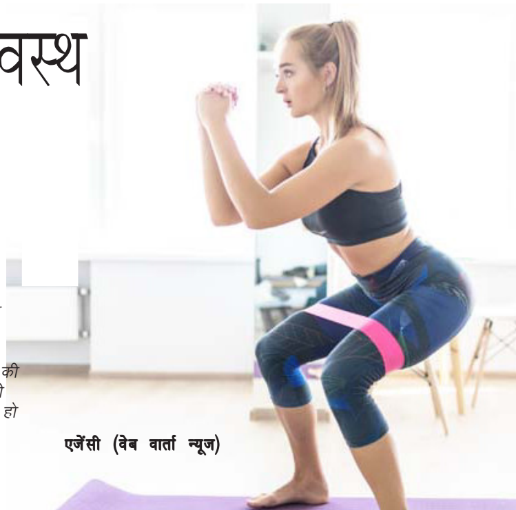
एर्जेसी (वेब वार्ता न्यूज)

कैंसर के मरीज और कैंसर का इलाज करवा चुके लोगों को अपने खानपान का विशेष ध्यान देना चाहिए। पोषिक आहार और संतुलित वजन बनाए रखने के लिए फल और हरी सब्जियों को अपनी डाइट में जरूर शामिल करें। डाइट में हाई एंटीऑक्सीडेंट रिच फूड शामिल करें। अगर आप नॉन-वेजिटेरियन हैं, तो रेड मीट को बजाए चिकन और फिश का सेवन करें।