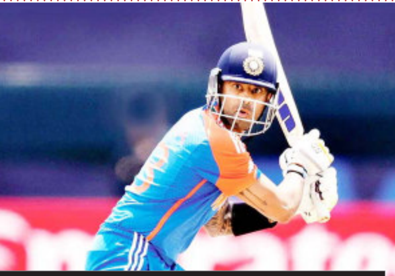
ये जिंदगी का हिस्सा है

सूर्यकुमार ने कहा कि आप क्रिकेट के मैदान पर जो कुछ भी कर रहे हो आपको जिंदगी नहीं है बल्कि जिंदगी का हिस्सा है। उन्होंने कहा, ये आपका जीवन नहीं है, ये आपके जीवन का हिस्सा है। इसलिए ऐसा नहीं है कि जब आप अच्छा कर रहे हो तो टॉप पर रहोगे और जब अच्छा नहीं कर रहे होंगे तो अंडरग्राउंड रहोगे। ये चीज आपको एक स्पोर्ट्समैन के तौर पर नहीं करनी चाहिए। इससे ही मुझे जीवन में संतुलन बनाने में मदद मिलती है।