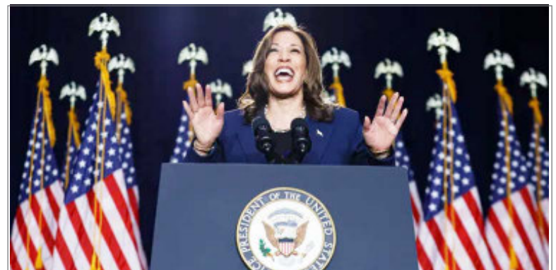
बाइडन के हटते ही कमला हैरिस की लगी लॉटरी

रिपोर्ट के अनुसार, 40 वर्षीय व्यक्ति, जो पेरिस के एक पाक विद्यालय में प्रशिक्षित एक पूर्व रियलिटी टीवी स्टार है, ने ओलंपिक के उद्घाटन समारोह में बाधा डालने का दावा किया था, जिसके बाद 21 जुलाई को उसे गिरफ्तार कर लिया गया। फ्रांसीसी प्रकाशन के अनुसार, गिरफ्तार व्यक्ति संघीय सुरक्षा सेवा, रूसी आंतरिक सुरक्षा और प्रति-खुफिया सेवा का एजेंट है। ले मॉंडे ने पेरिस के अभियोजक कार्यालय के हवाले से कहा कि उस व्यक्ति को पेरिस में उसके घर से गिरफ्तार किया गया। इस बात के सबूत उसके घर से मिले हैं कि वह व्यक्ति साजिश में शामिल था।