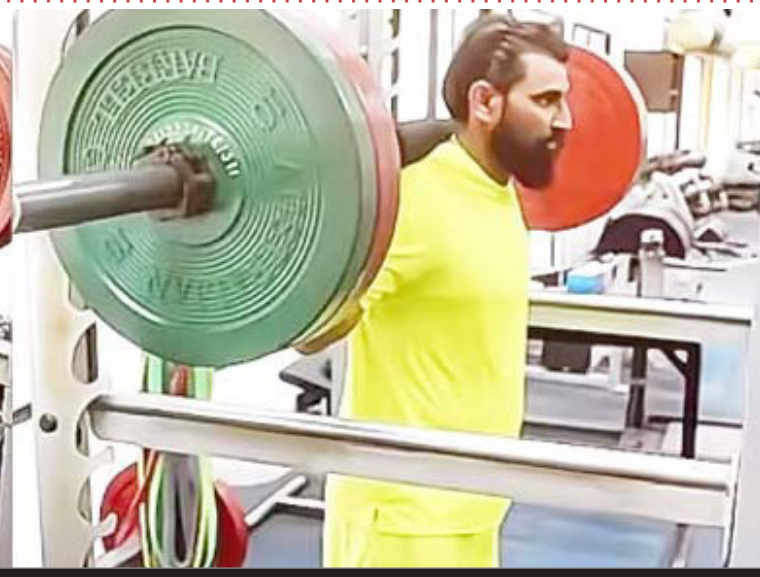
एडी की चोट से जुड़े शमी

बता दें कि वनडे वर्ल्ड कप 2023 के बाद मोहम्मद शमी एडी की चोट से परेशान रहे। शमी की चोट इतनी गंभीर रही कि उन्हें सर्जरी से गुजरना पड़ा। इस साल की शुरुआत में शमी की सर्जरी हुई, जिसके कारण वह आईपीएल और टी20 वर्ल्ड कप से बाहर हुए। शमी ने वनडे वर्ल्ड कप में शानदार प्रदर्शन करते हुए केवल 7 मैचों में 24 विकेट चटकाए थे।