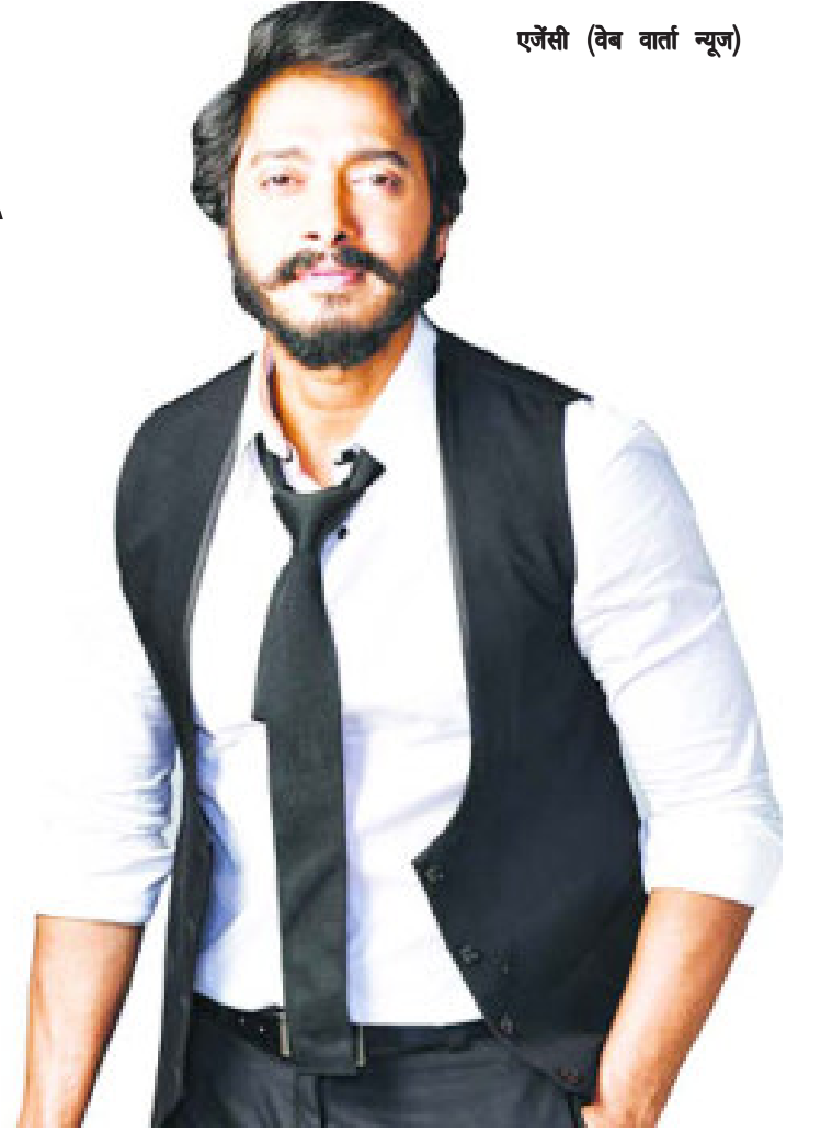
एजेसी (वेब वार्ता न्यूज)

आया था। वो अपकमिंग मूवी वेलकम टू द जंगल पर काम कर रहे थे। वो मिलिट्री एक्सरसाइज कर रहे थे, जब उन्हें हार्ट अटैक पड़ा। उन्होंने कहा, अचानक मुझे बेदम (हांफना) महसूस हुआ और मेरा बाया हाथ दर्द होने लगा। मैं मुश्किल से अपनी वैनिटी वैन तक जा पाया और कपड़े बदल पाया।