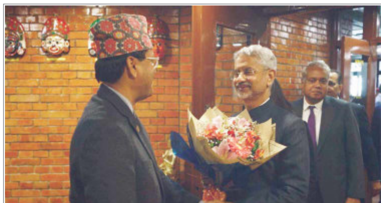
काठमांडू पहुंचे विदेश मंत्री एस जयशंकर

चार लोगों को सजा दी गई, चारों को हत्या का दोषी ठहराया गया था। इनमें दो फांसी उत्तर-पश्चिमी शहर ताबुक में, एक राजधानी रियाद में और एक दक्षिण-पश्चिम में जाजान में दी गई। साल 2023 में जिन 170 लोगों को मौत की सजा हुई उनमें 33 लोगों पर आतंकवाद संबंधी आरोप थे जबकि दो सऊदी सेना के सैनिक थे, जिन पर राष्ट्रद्रोह के आरोप थे। सऊदी अरब उन देशों में है, जहां सबसे ज्यादा मौत की सजा दी जाती है। 2022 में यहां सबसे ज्यादा लोगों को गोली मार कर या सिर काटकर मौत की सजा दी गई थी।