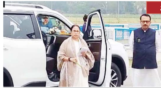
अचानक ब्रेक लगाने से ममता के सिर में लगी चोट

बंगाल में ममता बनर्जी अकेले लड़ेंगी लोकसभा चुनाव