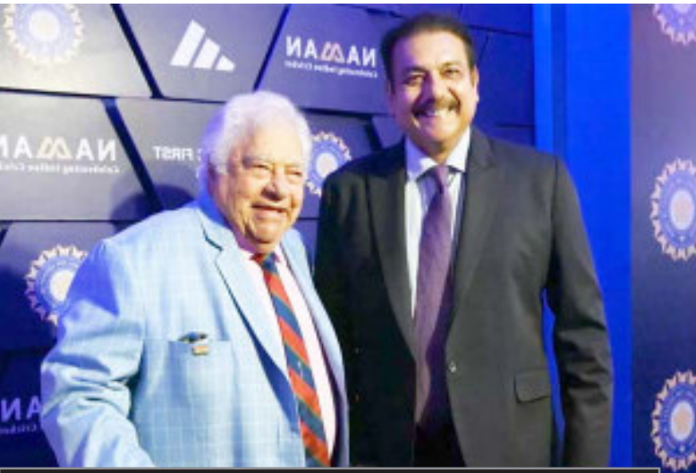
भावुक हुए शास्त्री

में खिलाड़ियों को धन्यवाद देता हूँ। शास्त्री इस अवॉर्ड को लेते हुए भावुक हो गए थे। उन्होंने कहा कि यह काफी बड़ा पल है। मैंने 17 साल की उम्र में खेलने शुरू किया था और 30 साल में संन्यास लिया था। बीसीसीआई हमेशा मेरे साथ मौजूद रहा। मैंने पिछले 40 सालों में बीसीसीआई को बढ़ते हुए देखा है और वर्ल्ड क्रिकेट में एक अहम बोर्ड बना है। यह मेरे लिए काफी खास पल है।