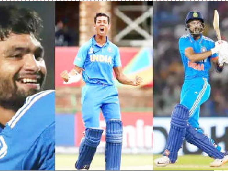
रिंकू सिंह के लिए खुला पूरा आसमां

साल 2023 में भारत की सबसे बड़ी खोज रिंकू सिंह रहे। बाएं हाथ के इस बल्लेबाज ने लोअर ऑर्डर में फिनिशर की भूमिका बखूबी निभाई। जबरदस्त आईपीएल सेशन के बाद उन्हें भारतीय टीम में एंट्री मिली। 2022 में उन्होंने भारत की ओर से 12 मैच में 180.68 की स्ट्राइक रेट से 262 रन बनाए।