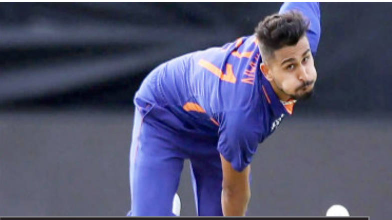
वेस्टइंडीज दौरे पर भी गए थे, जुलाई में खेला आखिरी वनडे

चोपड़ा ने कहा, कुछ समय पहले तक उमरान मलिक हर जगह थे। हम उन्हें वेस्टइंडीज भी ले गए और ऐसा लग रहा था कि वह विश्व कप टीम में भी हो सकते हैं, लेकिन अब वह किसी भी टीम में नहीं हैं। यहां तक कि इंडिया ए के लिए भी उन्हें नहीं चुना गया। भारतीय जर्सी में उमरान की आखिरी उपस्थिति वेस्टइंडीज के दौरे के दौरान थी, जहां उन्हें एक चुनौतीपूर्ण मुकाबले का सामना करना पड़ा था। सनराइजर्स हैदराबाद के गेंदबाजी कोच मुथैया मुरलीधरन सहित आलोचकों ने एक गेंदबाज के रूप में अपनी प्रभावशीलता बढ़ाने के लिए तेज गेंदबाज को सिर्फ तेज गति नहीं बल्कि अतिरिक्त कौशल विकसित करने की सलाह दी थी।