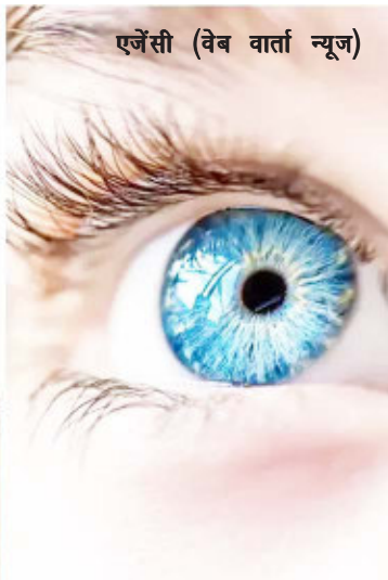
एर्जेंसी (वेब वार्ता न्यूज)