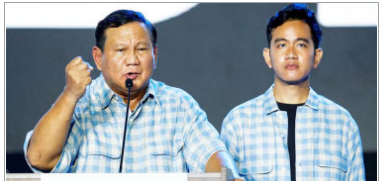
भारत की राह पर बढ़ेंगे सबसे बड़े मुस्लिम देश के नए राष्ट्रपति

सिंगापुर और स्पेन भी ऐसे देश हैं, जो फ्रांस के साथ खड़े हैं। भारत पिछले साल से एक पायदान नीचे गिरकर 85वें स्थान पर आ गया है। लेकिन अच्छी बात है कि पहले जहां भारतीय पासपोर्ट पर सिर्फ 60 देशों में जाया जा सकता था, वह संख्या अब बढ़कर 62 हो गई है। पाकिस्तान 106 नंबर का अपना रैंक बरकरार रखे हुए है, जो लिस्ट में नीचे से चौथा है। जबकि बांग्लादेश इस साल 101 से 102 पर पहुंच गया है। मालदीव 58वें स्थान पर है, जिसके नागरिक 96वें देशों में बिना वीजा जा सकते हैं। चीन की रैंकिंग में कुछ सुधार देखने को मिला है।