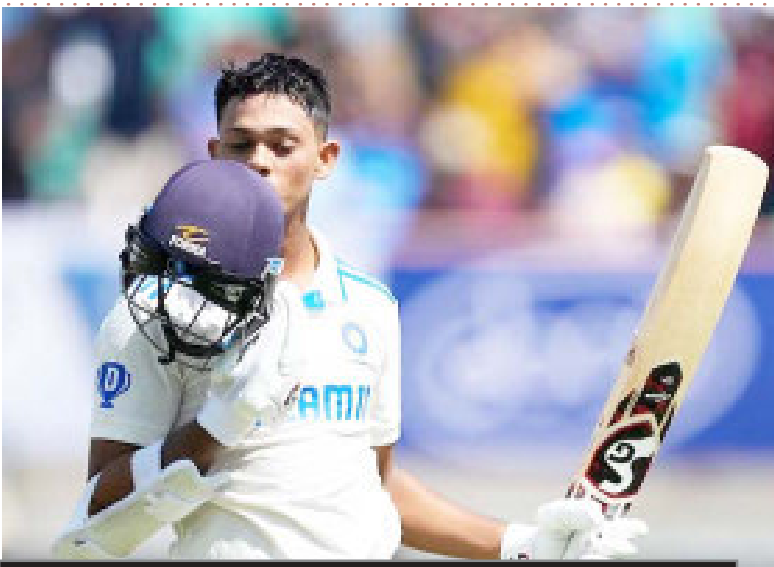
रोहित शर्मा को छोड़ा पीछे

जायसवाल ने एक पारी में सर्वाधिक 12 छक्के लगाने के वसीम अकरम के रिकॉर्ड की बराबरी की। इसके अलावा उन्होंने एक टेस्ट सीरीज में किसी भारतीय द्वारा सर्वाधिक छक्के लगाने के मामले में रोहित शर्मा के 19 छक्के को पीछे छोड़ दिया। जायसवाल अभी तक 22 सिक्स लगा चुके हैं। उन्होंने एंडरसन के ओवर में सिक्स की हैट्रिक लगाई थी।