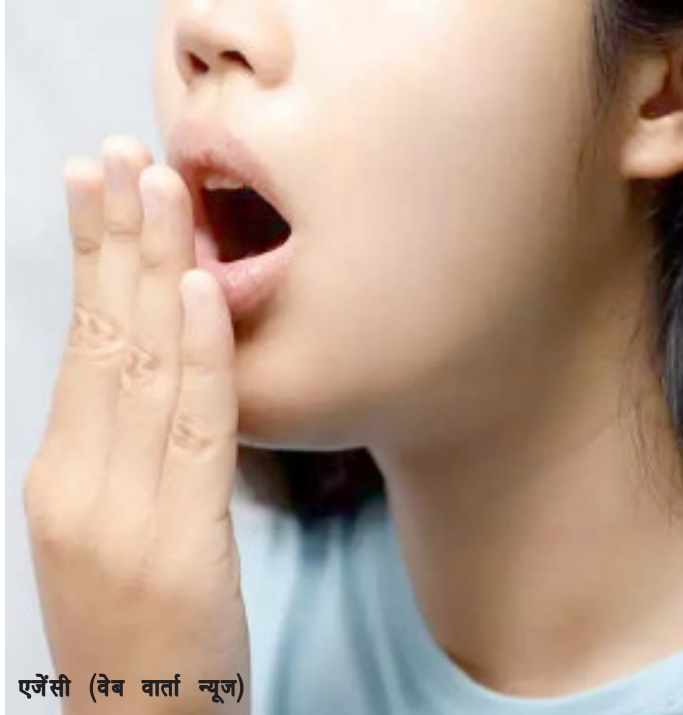
एजेंसी (वेब वार्ता न्यूज)

कारण ड्राइनेस होने लगती है। ऐसा होने पर मुंह में सूखापन होने लगता और बैक्टीरिया बढ़ने लगता है। अगर आप तंबाकू जैसे खाद्य पदार्थों का सेवन करते हैं तो इसे पूरी तरह से बंद कर दें। यह भी मुंह से बदबू आने का एक कारण हो सकती है। इसके अलावा जिन लोगों में कब्ज, गैस और एसिडिटी की समस्या होती है, उन्हें भी सुबह मुंह की बदबू की समस्या देखी जाती है।