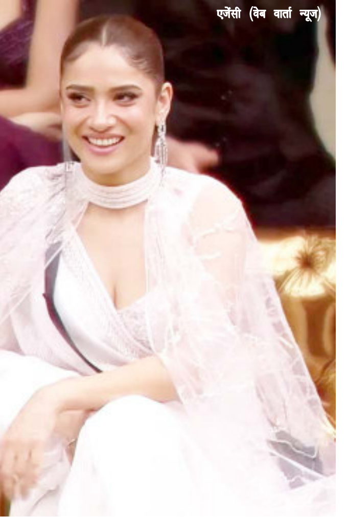
एजेंसी (वेब वार्ता न्यूज़)