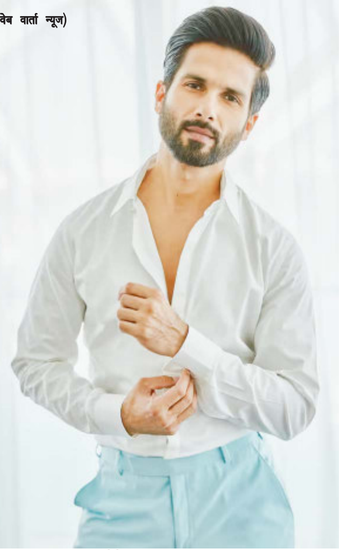
एजेसी (वेब वार्ता न्यूज)