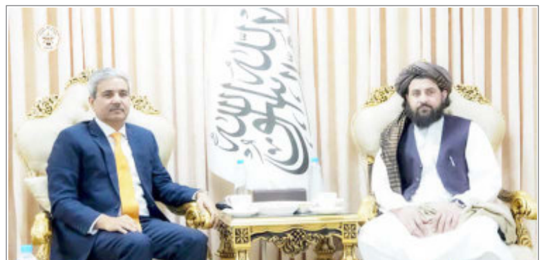
भारत साथ दे तो अफगानिस्तान से पाकिस्तान की छुट्टी

हाल की न्यूक्लियर सबमरीन से के-4 बैलिस्टिक मिसाइल का सफल परीक्षण किया है, जो बहुत बड़ी कामयाबी है। इसकी क्षमता 3500 किलोमीटर है। भारत के वर्तमान में अरिहंत और अरिघात श्रेणी की परमाणु चालित पनडुब्बियां हैं। एक दिन पहले सोमवार को ही भारतीय नौसेना प्रमुख ने भारत की पूर्ण स्वदेशी निर्मित पनडुब्बी को शामिल करने की योजना का खुलासा किया है। अब्दुल बासित ने कहा कि भारत रक्षा पर भारी खर्च कर रहा है और जवाबी हमला करने की क्षमता की तरफ जा रहा है। पाकिस्तान के पास सबमरीन तो हैं, लेकिन न्यूक्लियर पावर्ड सबमरीन नहीं हैं।