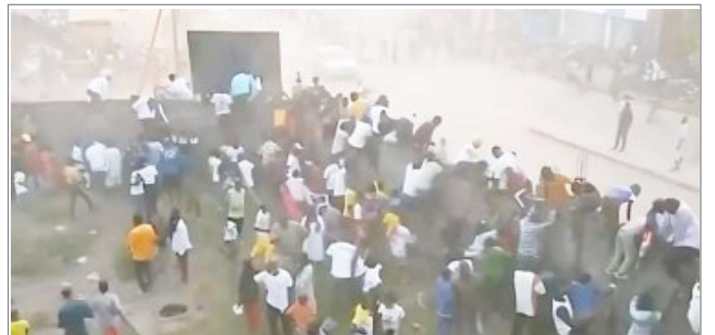
गिनी में फुटबॉल मैच के दौरान फैंस के बीच हुई झड़प

क्षेत्रों में संचार काट दिया गया है। इससे कुर्दों के नरसंहार की आशंका बढ़ गई है। ऑब्जर्वेटरी ने इससे पहले कहा था कि तुर्की समर्थक गुटों ने सरकारी बलों को मार डाला और फिर अलेप्पो प्रांत में कुर्द लड़ाकों पर हमला किया। उन्होंने खासतौर से कुर्द आपूर्ति लाइनों को काटने को लक्ष्य बनाया है। ऑब्जर्वेटरी ने बताया है कि अलेप्पो शहर के उत्तर में कुर्द बलों और तुर्की समर्थक गुटों के बीच झड़प हुई। इसके बाद तुर्की समर्थित समूहों ने सरकारी बलों को पीछे धकेला और अलेप्पो के दक्षिण-पूर्व में सफिरह और खानसेर शहरों पर नियंत्रण कर लिया।