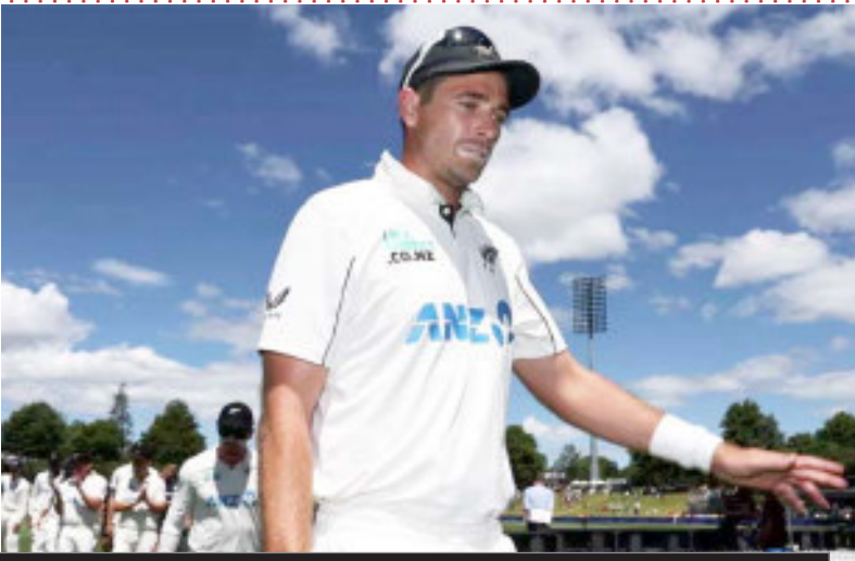
फेयरवेल मैच के बाद टिम साउदी हुए भावुक