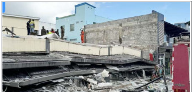
वानुअतु में भूकंप से मची तबाही

दिया है, जो सत्ता पर उनकी पकड़ के लिए खतरा पैदा कर सकता है। कनाडा के पीएम को यह झटका ऐसे समय में लगा है, जब लगातार उनकी लोकप्रियता कम हो रही है। लिबरल पार्टी के नेता टूडो अपने मुख्य प्रतिद्वंद्वी कंजर्वेटिव पार्टी के पियरे पोलिएवर से 20 अंकों से पीछे हैं। फ्रीलैंड ने अपने इस्तीफे में कहा कि हमारा देश एक गंभीर चुनौती का सामना कर रहा है। पिछले कुछ हफ्तों से आप और मैं कनाडा के लिए आगे के सर्वोत्तम रास्ते के बारे में खुद को असहमत पाते हैं। उन्होंने कनाडा के आयात पर ट्रंप के 25 प्रतिशत टैरिफ लगाने की योजना की तरफ इशारा किया।