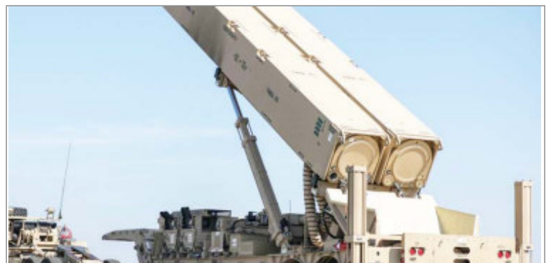
अमेरिका ने तैयार किया रूसी एयर डिफेंस सिस्टम एस-400 का काल

एजेंसी (वेब वार्ता न्यूज) वाशिंगटन। अमेरिकी गृह सुरक्षा विभाग (डीएचएस) एच-1बी और एल-1 वीजा धारकों के जीवनसाथियों के लिए स्वचालित वर्क परमिट नवीनीकरण अवधि को 180 दिनों से बढ़ाकर 540 दिन करेगा। यह बदलाव 13 जनवरी, 2025 से प्रभावी होगा और 4 मई, 2022 को या उसके बाद दाखिल किए गए आवेदनों पर लागू होगा। इस विस्तार का उद्देश्य प्रसंस्करण में देरी के कारण काम में आने वाली रुकावटों को रोकना है, जो कि पहले भी रिपोर्ट की गई एक समस्या है। ग्रीन कार्ड चाहने वाले एच-1बी वीजा धारकों के जीवनसाथी और एल-1 वीजा धारकों के जीवनसाथी वर्क परमिट के लिए पात्र हैं। होमलैंड सिक्वोरिटी के सचिव एलेजांद्रो एन. मयोरकास ने कहा, जनवरी 2021 से, अमेरिकी अर्थव्यवस्था ने 16 मिलियन से अधिक नौकरियां पैदा की हैं। उन्होंने कहा, कुछ रोजगार प्राधिकरण दस्तावेजों के लिए स्वचालित विस्तार अवधि बढ़ाने से लालफीताशाही को खत्म करने में मदद मिलेगी जो नियोक्ताओं पर बोझ डालती है, यह सुनिश्चित करेगी कि रोजगार के लिए पात्र लाखों व्यक्ति हमारे समुदायों में योगदान करना जारी रख सकें, और हमारे देश की मजबूत अर्थव्यवस्था को और मजबूत करेगी।