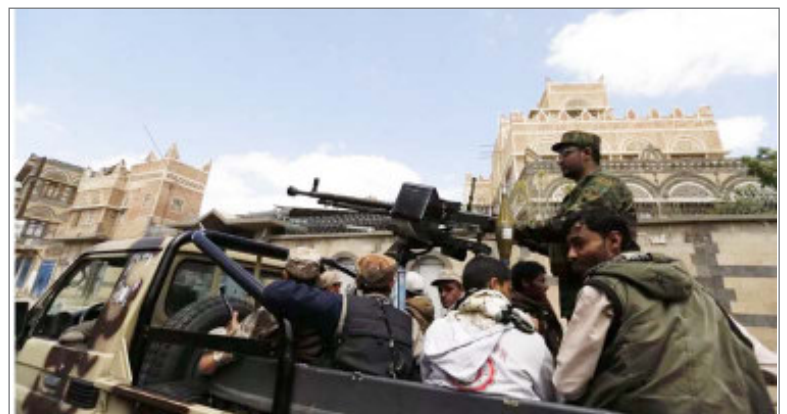
अमेरिकी, ब्रिटिश व इजरायली जहाज को बनाया निशाना

बर्लों के आगे हार गई। इस शहर पर विद्रोहियों का कब्जा इसलिए भी महत्वपूर्ण है क्योंकि म्यांमार का जमीन के रास्ते होने वाला अधिकांश व्यापार इसी रास्ते से होता है। इतना ही नहीं, म्यांमार की जुंटा को लड़ाई में बड़ी संख्या में सैनिक भी गंवाने पड़े हैं। उनमें से कुछ मारे गए, घायल हुए और कुछ ने सरेंडर कर दिया या पाला बदलकर विद्रोही बलों के साथ मिल गए। अब नई भर्ती करना मुश्किल हो रहा है, क्योंकि बहुत कम लोग ही इस समय सेना में जाना चाह रहे हैं। उन्होंने बीबीसी सो बताया कि उन्हें सिटवे में इंफैंट्री बटालियन के एक बेस पर ले जाया गया।