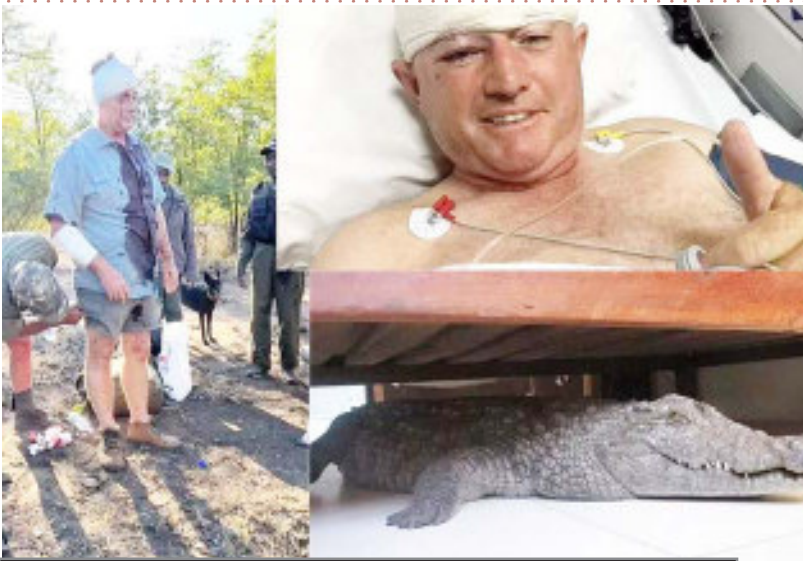
चिकारा के बहुत आभारी

हनाह ने कहा, हम चिकारा के बहुत आभारी हैं। चिकारा को पार्टी में कुछ अतिरिक्त चिकन मिलना तय है। चिकारा को कुछ हल्की-फुल्की चोटें आई हैं और उसका उपचार चल रहा है। वो जल्द ही ठीक हो जाएंगे। अच्छी बात यह है कि गाय विटल भी बात कर पा रहे हैं। वो सभी को बता रहे हैं कि किस तरह तेंदुए से लड़े, लेकिन हम सभी जानते हैं कि चिकारा ने ही उन्हें बचाया है।