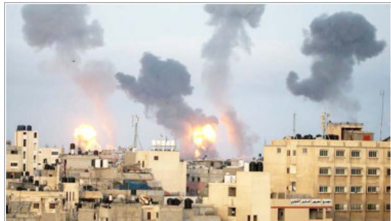
हिजबुल्लाह पर इजरायल ने किया पलटवार

यूक्रेन को मिली नई मिसाइल 300 किलोमीटर तक मार करने वाली है। पता चला है कि अमेरिका ने अक्टूबर 2023 से यूक्रेन को इन मिसाइलों को देना शुरू किया था। अब जबकि अमेरिकी राष्ट्रपति जो बाइडन ने 95 अरब डॉलर की सहायता स्वीकृत कर दी है तो उसके अंतर्गत भी ये मिसाइलें यूक्रेन को दी जाएंगी। माना जा रहा है कि युद्ध में इन मिसाइलों के इस्तेमाल से यूक्रेन को ताकत मिलेगी।