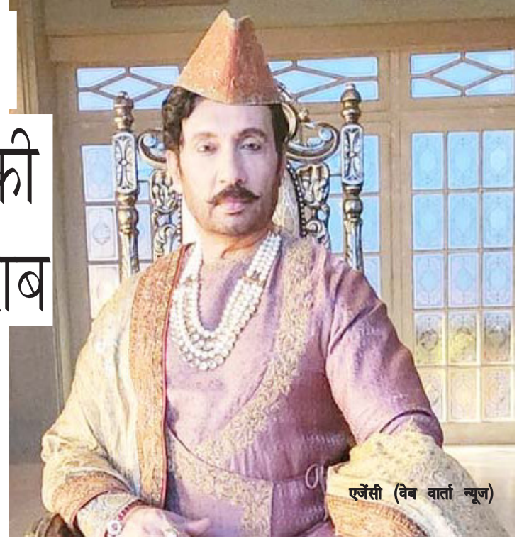
ऐसी (वेब वार्ता न्यूज)

और दर्शन देगा। कहीं ना कहीं, हमने उनकी बातों पर विश्वास कर लिया कि ऐसा होगा और उसी दिशा में हम सोचने लगे।