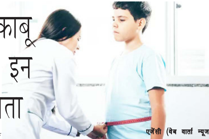
एजेंसी (वेब वार्ता न्यूज)

डायबिटीज लोगों के लिए जानलेवा बनती जा रही है। यह एक क्रॉनिक कंडीशन है, जो आजकल कच्चा बुजुर्ग कच्चा जवान सभी को प्रभावित कर रही है। टिनएजर्स और 20 साल के आसपास के युवा इस बीमारी की चपेट में ज्यादा आ रहे हैं। बता दें कि युवाओं में टाइप 1 और टाइप 2 डायबिटीज दोनों देखी जा रही हैं, लेकिन टाइप 2 डायबिटीज जिसे डायबिटीज मेलिटस कहते हैं के लक्षण दिखाई न देने के कारण इसका निदान देर में हो पाता है। अमेरिका के रिसर्चर्स ने 2002 से 2017 तक के आंकड़ों का विश्लेषण करते हुए भविष्यवाणी की है कि देश में टाइप 1 और टाइप 2 डायबिटीज वाले युवाओं की संख्या 2017 में 213,000 से बढ़कर 2060 में 239,000 हो जाएगी। अगर यहां बताए गए कुछ संकेतों पर जल्दी ध्यान दिया जाए, तो युवाओं में डायबिटीज को बढ़ने से रोका जा सकता है।