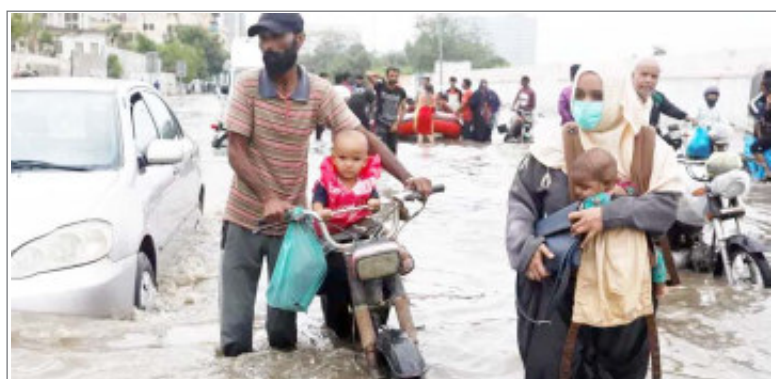
पाकिस्तान में भारी बारिश का कहर

चौकाने वाली बात यह है कि आतंकी संगठनों ने 2024 की पहली तिमाही में आतंकी घटनाओं के कारण हुई कुल मौतों में से 20 प्रतिशत से भी कम की जिम्मेदारी ली है। हालांकि, इस दौरान जाभात अंसार अल-महदी खुरासान (श्रा।इज) नाम का एक नया आतंकी संगठन भी उभरा है।