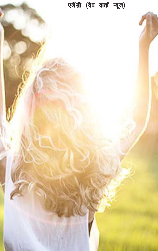
एजेंसी (वेब वार्ता न्यूज)

इस कमी को पूरा करने वाले 2 देसी उपाय बताए हैं। जिनसे हड्डियों में ताकत भर जाएगी और बच्चों की हाइट बढ़ने लगेगी।