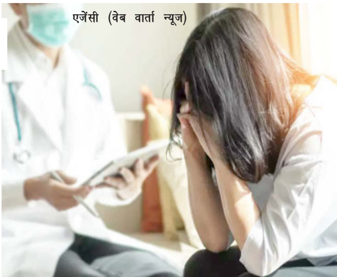
एजेंसी (वेब वार्ता न्यूज)

जाता है। जीवनशैली के इन परिवर्तनों से हृदय के स्वास्थ्य पर असर होता है। महिलाओं में पुरुषों के मुकाबले मनोवैज्ञानिक जोखिम के तत्वों जैसे बचपन की विपत्तियों, पोस्ट ट्रॉमेटिक स्ट्रेस डिसऑर्डर, और अवसाद की संभावना भी ज्यादा होती है।