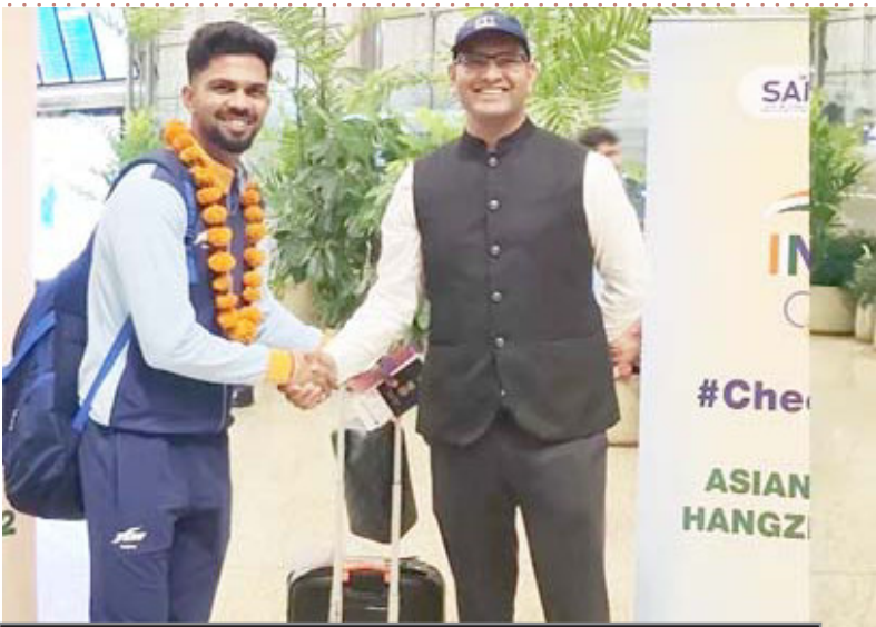
एशियन गेम्स के लिए भारतीय स्वचाद

रुतुराज गायकवाड़ (कप्तान), यशवीर जायसवाल, राहुल त्रिपाठी, तिलक वर्मा, रिकू सिंह, जितेश शर्मा, वॉशिंगटन सुंदर, शाहबाज अहमद, रवि बिश्नोई, आवेश खान, अर्शदीप सिंह, मुकेश कुमार, शिवम मावी, शिवम दुबे और प्रमसिमरन सिंह। स्टैंडबाई खिलाड़ी: यश ठाकुर, साई किशोर, वेंकटेश अय्यर, दीपक हूडा और साई सुदर्शन।